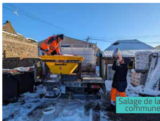
Salage de la commune