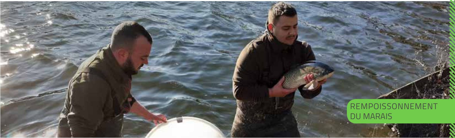
REPOISSONNEMENT DU MARAIS