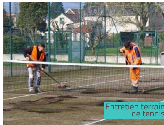
Entretien terrain de tennis