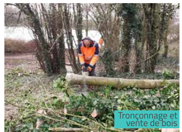
Tronçonnage et vente de bois