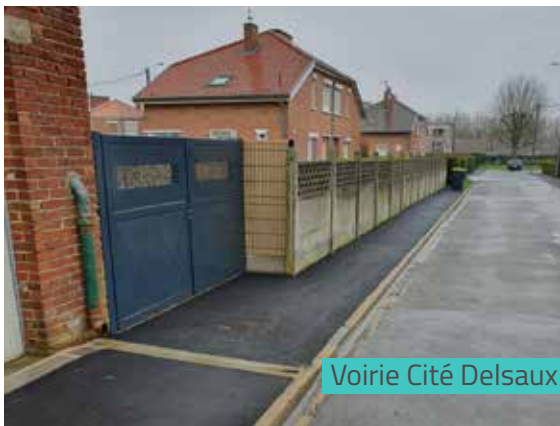
Voirie Cité Delsaux