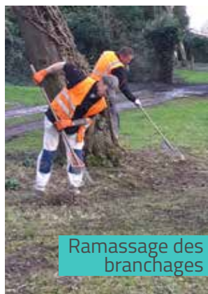
Ramassage des branchages