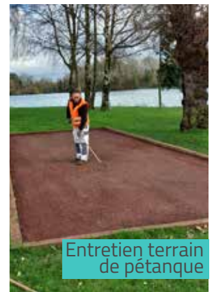
Entretien terrain de pétanque